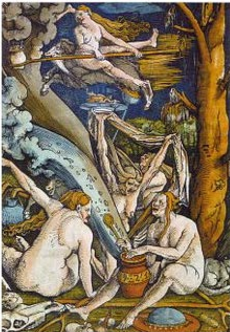
Heksen, van Hans Baldung, 1511, houtsnede

Heksen bleven beschuldigd worden van slecht weer, onvruchtbare grond, onvruchtbare vrouwen en dieren, mislukte oogsten en voor niet-natuurlijke ziekten.