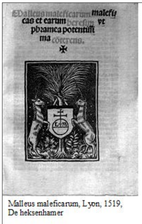
Malleus maleficarum, Lyon, 1519, De heksenhamer

Een uitgewerkte argumentatie tegen het bestaan van heksen kwam van twee dekens uit Wurttemberg. Zij stelden, dat niet heksen maar uitsluitend God verantwoordelijk was voor het klimaat, hetgeen ook door sommige reformatoren gesteld werd. Een van deze dekens, Johann Weyer, ging een stap verder. In zijn werk, verschenen in 1563, concludeerde hij, dat de misdaad van hekserij domweg niet bestond en dat het een duivelse illusie is.