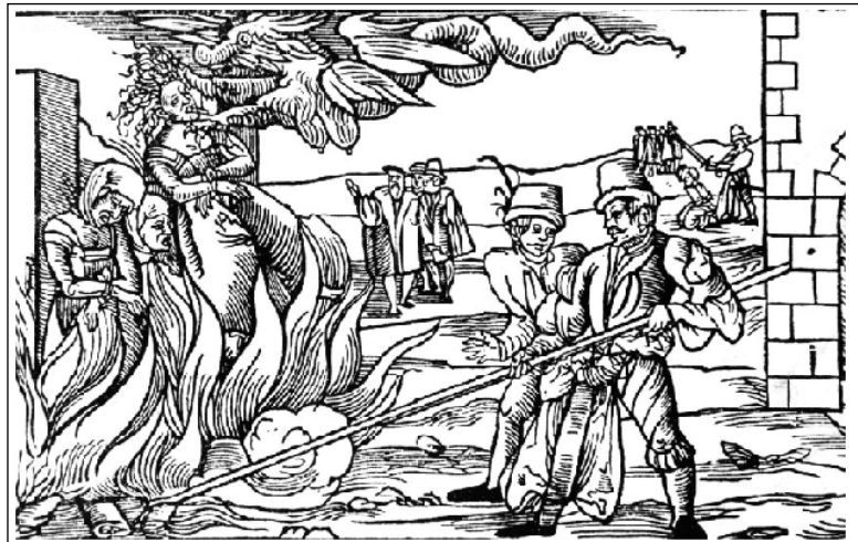
Heksenverbranding te Dernburg, 1555

was de Lutheraans predikant Thomas Naogeorgus (1508-63) te Duitsland. Hij beschuldigde heksen ervan slecht weer, misoogsten en epidemieën te veroorzaken. Zijn preken verschenen al snel in druk en werden verspreid. Er ontstond hier een sterke binding tussen de barre jaren van de Kleine IJstijd en heksenjacht. In de begin jaren 60 van de 16 e eeuw en gedurende de hongercrisis van de jaren 70