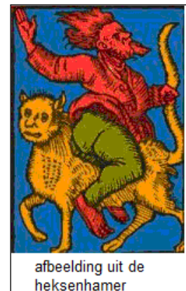
afbeelding uit de heksenhamer

Al snel ontstond er commentaar op de heksenvervolging, eveneens vanuit de geleerden hoek. Gedurende de 15 e eeuw waren heksenrechtbanken niet overal geaccepteerd. Zij, die bepleitten heksen te vervolgen, hadden te doen met sterke weerstand zoals onder andere de auteur van Malleus Maleficarum (letterlijk: Hamer van de boosdoeners), kortom de Heksenhamer, de inquisiteur Heinrich Kramer, bemerkte. De Heksenhamer verscheen in 1485-86 voor het eerst en kenden een grote en snelle verspreiding door de net ontwikkelde boekdrukkunst (1450). Weer terug naar Kramer, hij werd uit Tirol verbannen wegens illegale methoden. In Noord Italië, na heksenvervolgingen in het diocees Como ontstond een heftig debat waarbij de Fransicanen en wetsexperts zich tegen de onwettige praktijken van de heksenvervolgers richtten.